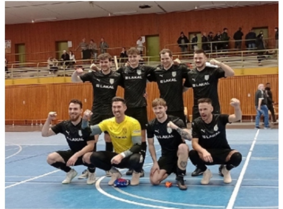
Turnier SF Hostenbach - Sieger SC Halberg Brebach