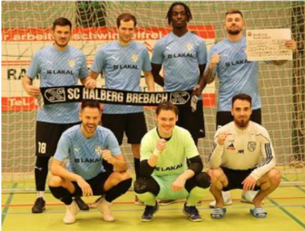
Turnier SV Bübingen - Sieger SC Halberg Brebach